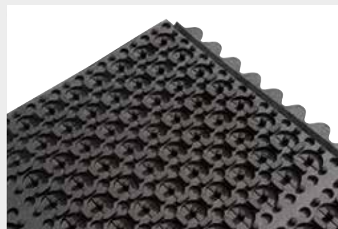
Connexions de la face inférieure