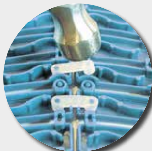
Montage des clips avec un marteau pour joindre un rouleau à un autre