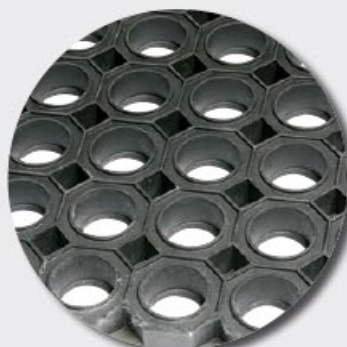
Face supérieure M69