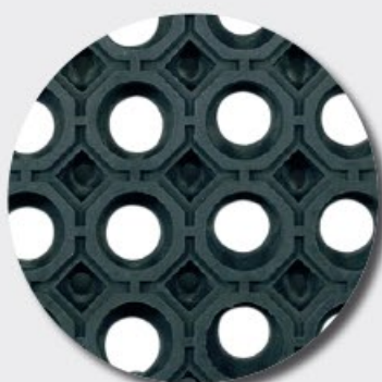
Face supérieure M69PLUS