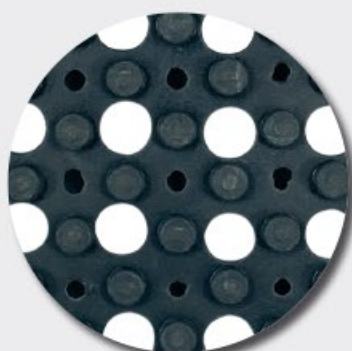
Face inférieure M69PLUS