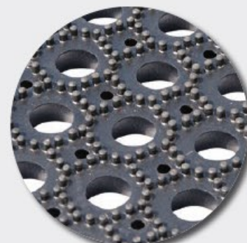
Face inférieure M69