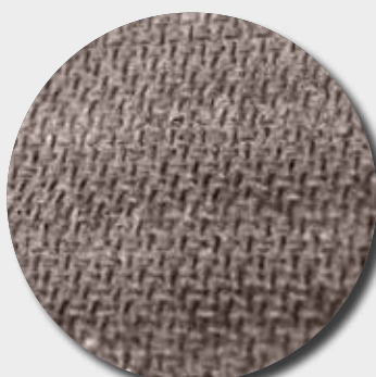
Semelle gel latex