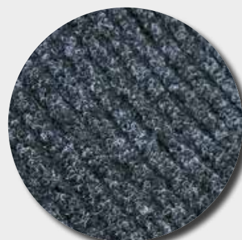
Fibres grattantes et absorbantes