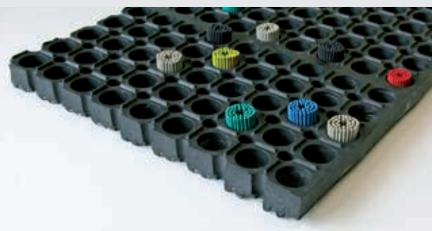
M26 + brosses