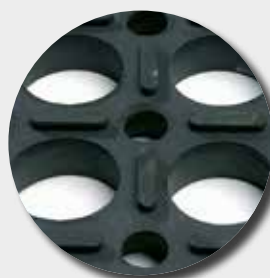
Face inférieure M24