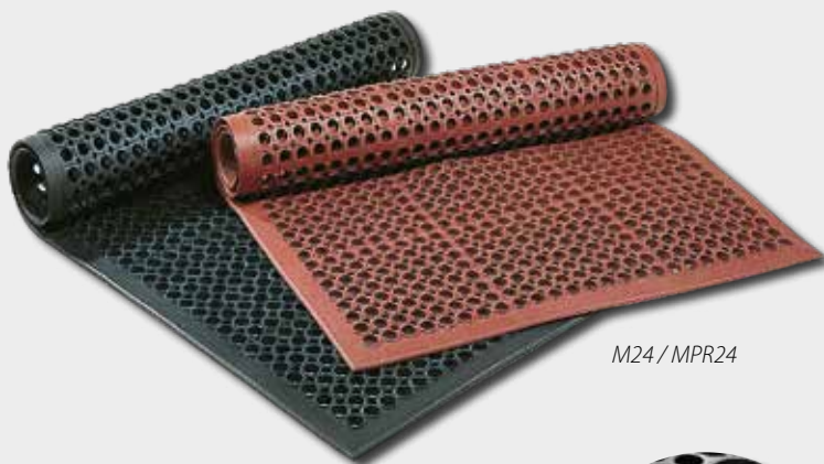
M24 / MPR24