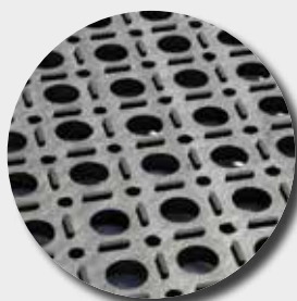
Face inférieure M6080BB