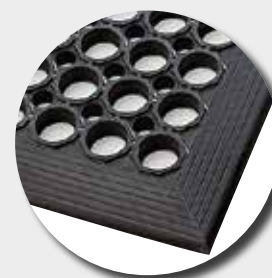
Face supérieure M24