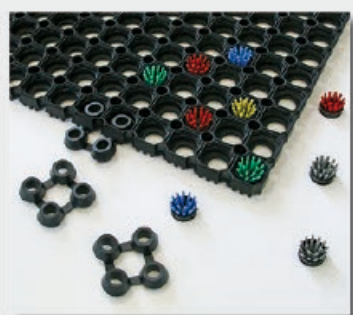
Brosses + jonctions