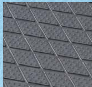
Clip Super / face supérieure