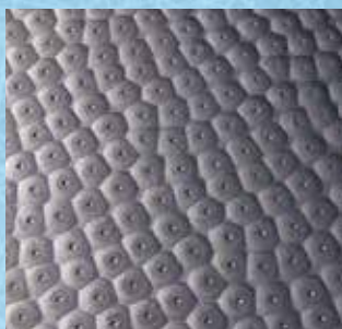
Clip 18 / face supérieure