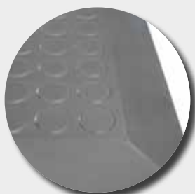
PU85 - face supérieure