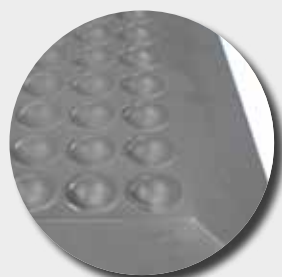
PU84 - face supérieure