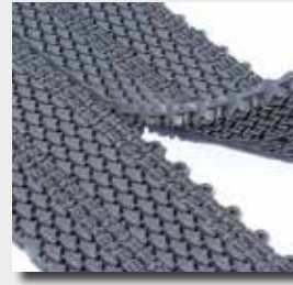
Connexion entre les dalles