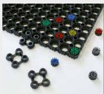
Brosses + jonctions