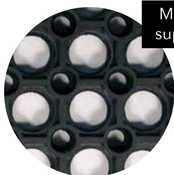
M67 Face supérieure