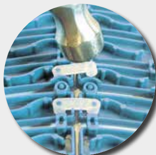
Montage des clips avec un marteau pour joindre un rouleau à un autre