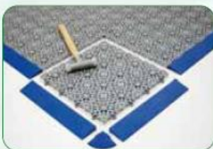
Bordures et angle Edges and corner

Can be used both outdoors and indoors. Good ventilation when floors are wet, thanks to the honeycomb structure. Very easy to install. The edges and corners allow you to achieve perfect finishing. Non-slip surface, easy maintenance. Weight resistance: 400T/m 2 . Expansion joints: to be placed every 2.5 to 3 linear meters (i.e. every 8 to 10 tiles).