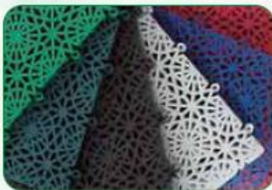
Coloris / Colours