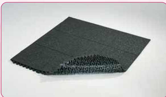
Dessous MB46 / MB46 underside