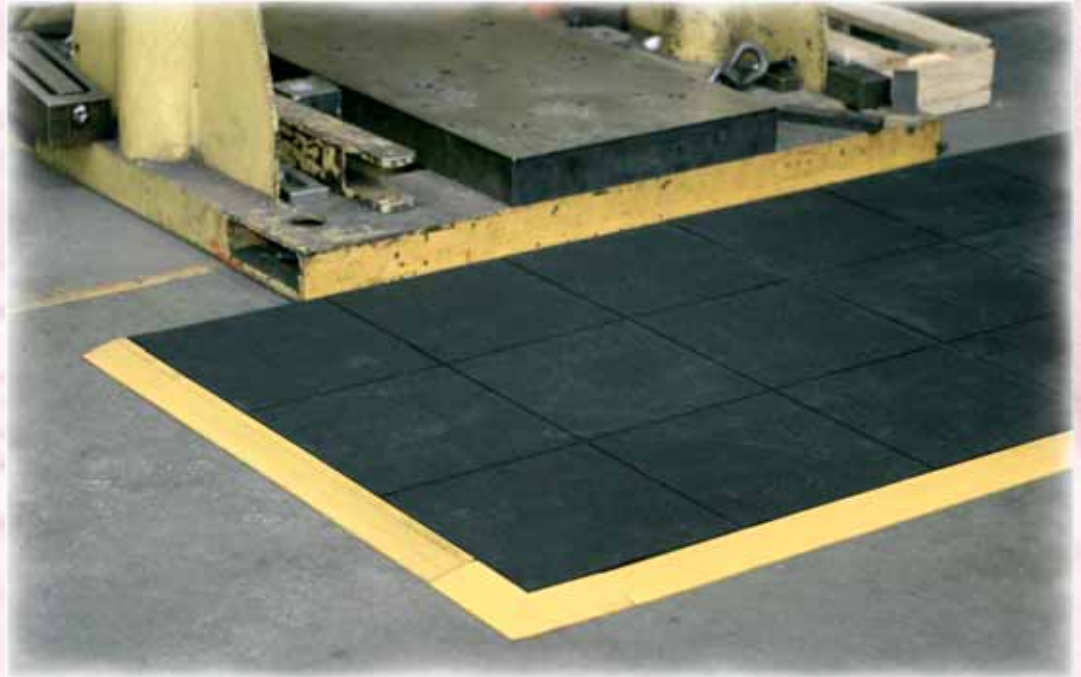
MB45 avec bordures et angle jaune / MB45 with yellow edges and corner

100% caoutchouc naturel. Coloris : noir, bordures noires, jaunes.