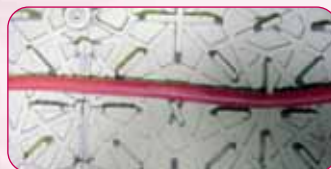
Dessous / underside