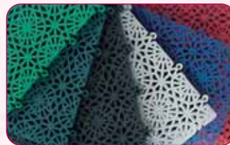
Coloris / Colours