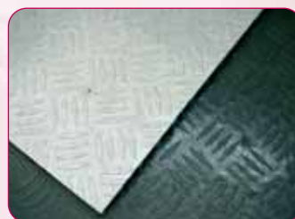
Coloris / Colours