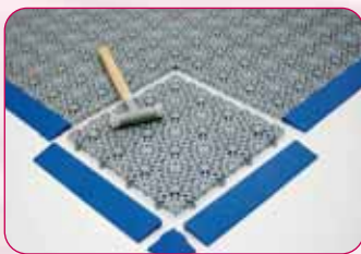
Bordures et angle Edges and corner

UV-resistant polypropylene. Colours: black, red, light green, dark green, blue.