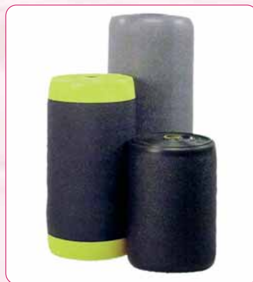
NT427BY / NT427B