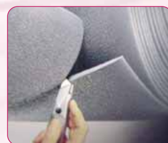
Découpe à la demande Cut on request